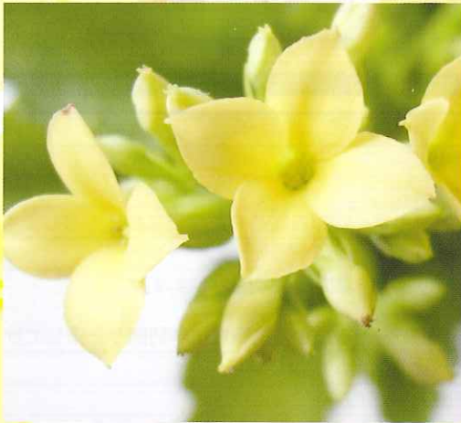
カランコエ/花言葉(あなたを守る)

しんきん傷害保険付定期積金「サポート定積」は、 新しいカタチの定期積金。 ご自分のライフプランに合わせて 夢の実現のために、 毎月コツコツ積み立てましょう。 傷害保険付なので、 もしもの時はご家族の安心もカバーします。 5年後のご自分に、 ご家族にとびきりの笑顔を贈ります。