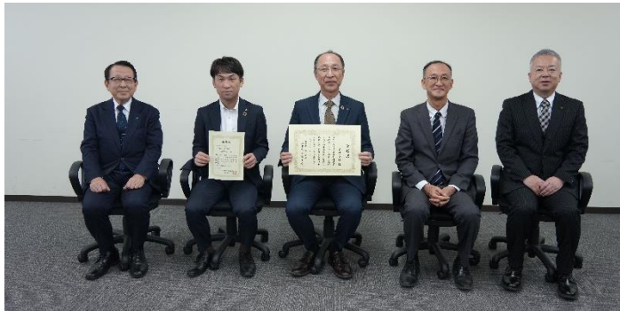
左から同上、大宮副部長、土田常務、同上