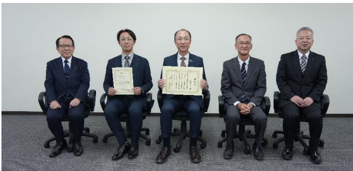
左から同上、松野副部長、同上