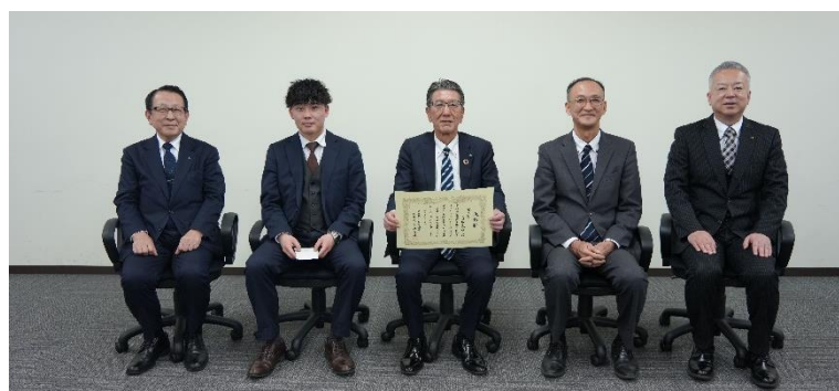
左から同上、名取支店職員（中央：大坂支店長）、同上