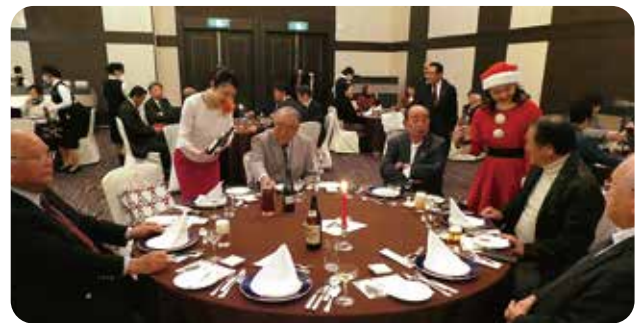
宮信オーナーズクラブ クリスマス会(2023年12月19日)