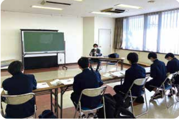
2023年10月25日～26日 仙台市立富沢中学校