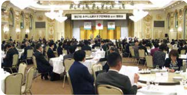
みやしん絆クラブ定例総会(2024年2月9日)

地域の事業経営者を中心に、会員相互の異業種交流並びに親睦により、会員の事業発展を目的としたサークルです。会員相互の絆、みやしんと会員との絆、地域社会との絆を通じ、情報交換の場として役立てられております。