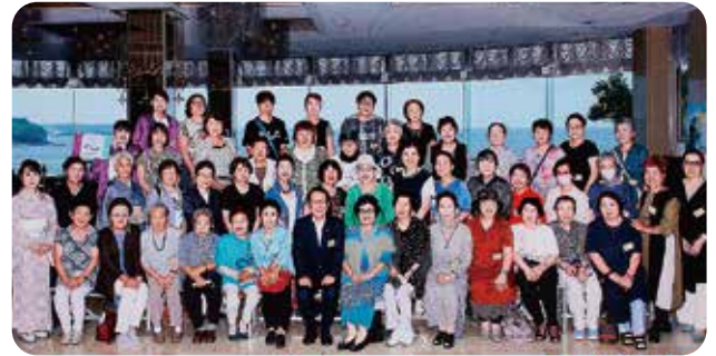
みやしんファーストレディースクラブ親睦旅行(2023年9月7日~8日) 「登米・気仙沼と南三陸の旅」

地域の女性の皆さままで組織されたサークルで、講演・グルメ・各種趣味の会・お茶会・旅行等多彩な活動を通じてお互いの交流を深めております。