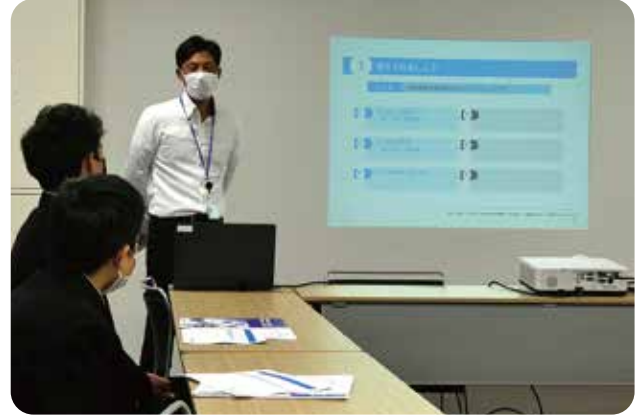
2023年11月14日～15日 亶理町立逢隈中学校