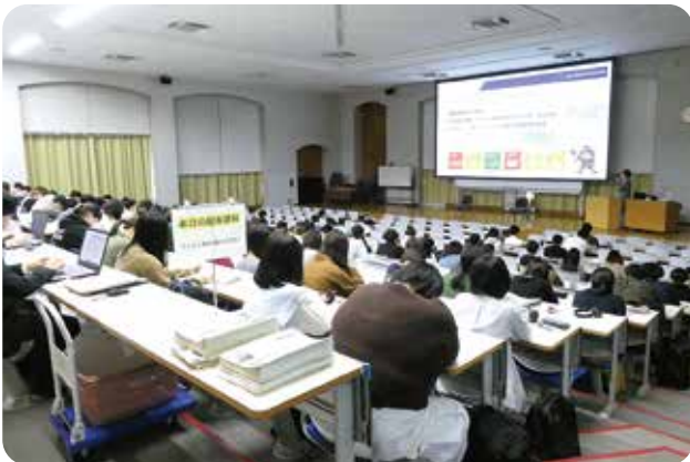
2023年10月5日 尚綱学院大学