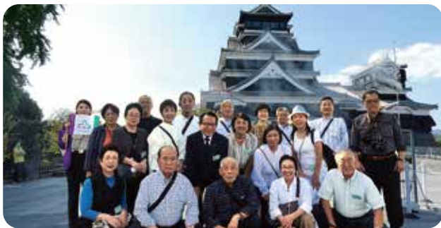
宮信オーナーズクラブ研修旅行(2023年10月11日~13日) 「熊本・天草・雲仙・長崎方面」

企業経営に意欲的な経営者の集まりで、経営セミナー・研修等を通じて、相互の情報交換の場として役立てられております。