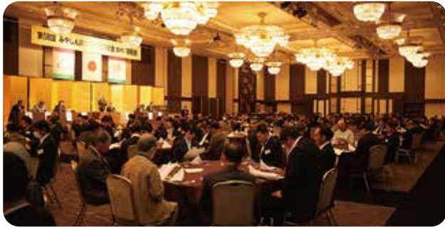
みやしん絆クラブ定例総会(2025年2月10日)

地域の事業経営者を中心に、会員相互の異業種交流並びに親睦により、会員の事業発展を目的としたサークルです。会員相互の絆、みやしんと会員との絆、地域社会との絆を通じ、情報交換の場として役立てられております。