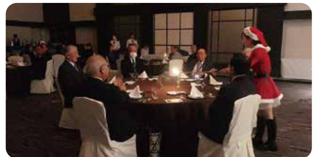
宮信オーナーズクラブ クリスマス会(2024年12月23日)