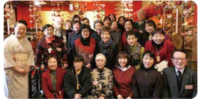
みやしんファーストレディースクラブ親睦旅行(2025年2月3日～4日) 山形県西川町「月山の旅」

地域の女性の皆さままで組織されたサークルで、講演・グルメ・各種趣味の会・お茶会・旅行等多彩な活動を通じてお互いの交流を深めております。