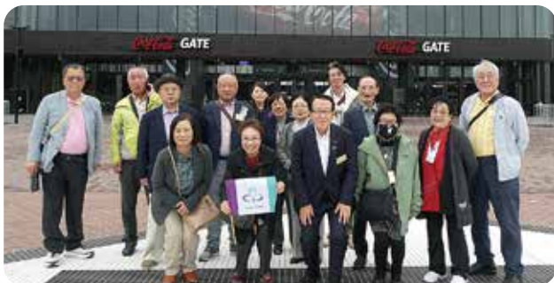
宮信オーナーズクラブ研修旅行(2024年10月2日～4日) 北海道(小樽・定山溪・札幌)を巡る

企業経営に意欲的な経営者の集まりで、経営セミナー・研修等を通じて、相互の情報交換の場として役立てられております。