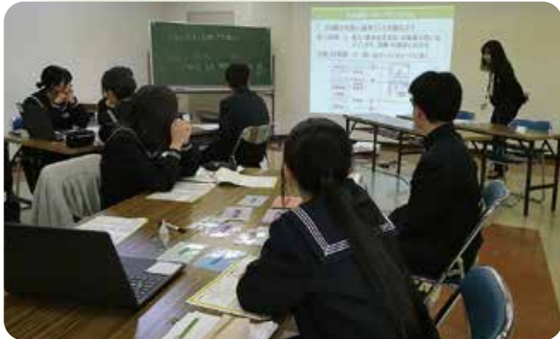
2024年11月12日～13日 仙台市立富沢中学校

● 中学生を対象とした職場体験学習とマネースクールを実施いたしました。金融の仕事について興味を持っていただくため、継続的に実施しています。